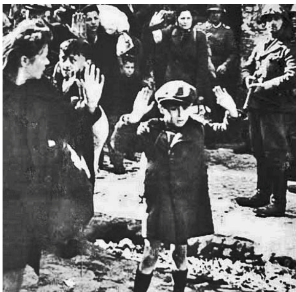
Warszawas ghetto 19. april 1943