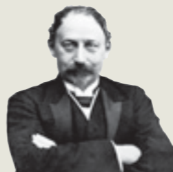
EDVARD BRANDES (1847-1931) STIFTER AF POLITIKEN I 1884

Opinion Rådhuspladsen 37 1785 København V Telefon, Debat 33 47 23 31 Telefon, Kronik 33 47 23 37 Fax 33 15 41 17