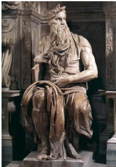
Michelangelo : Moses

5. Senere, da han havde ført folket ud af Ægypten, gik han op på Sinaj bjerg for at modtage lovens tavler af Gud. Men Gud kunne se, at israelitterne nede i ørkenen var begyndt at dyrke guldkalven. Gud ville udslette folket, men Moshe forhandlede med Gud og fik ham overtalt til at glemme sin vrede og lade være med at udrydde folket.