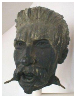
J. F. Willumsens portrætbuste af Viggo Hørup (Willumsenmuseet i Frederiksværk,)

Den politiske kamp mellem Højre og Venstre handlede om forfatning og forsvar. Men striden greb om sig og medførte brydninger i alliancen mellem grundtvigianerne, "det litterære venstre" og socialdemokraterne.