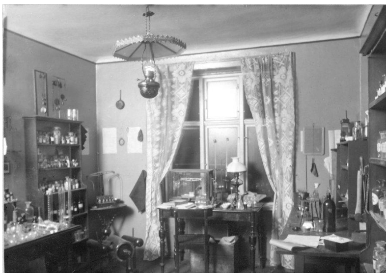
Kemisk oplysningskontor for Haandværkeres Laboratorium, Gothersgade 167 III 26